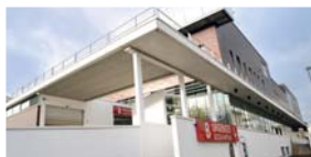
22 CENTRE URGENCES RÉANIMATIONS