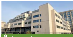
8 BÂTIMENT MÉDICO-TECHNIQUE ET HÉMATOLOGIE CLINIQUE ADULTES