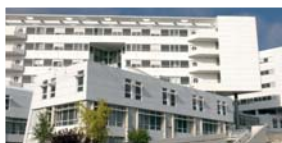
50 CENTRE CARDIO-PNEUMOLOGIQUE