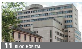
11 BLOC HÔPITAL