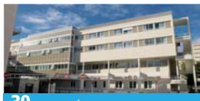
30 CENTRE HÉPATO-DIGESTIF PAVILLON LAENNEC